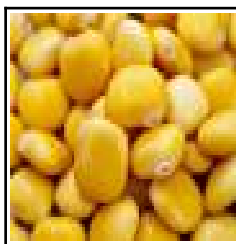
Graines de LUPIN