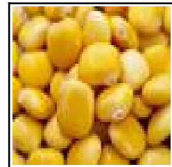
Graines de LUPIN